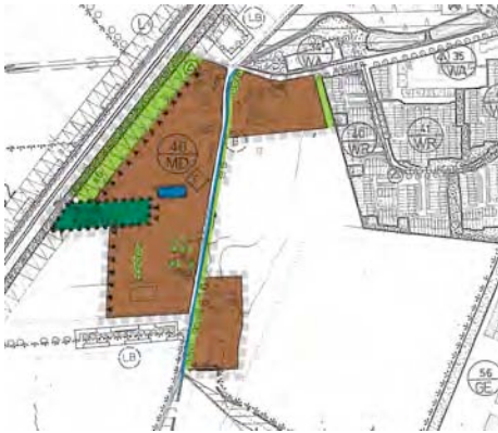
25. Änderung Teil I des Flächennutzungsplanes Unterschleißheim, 20.07.2009