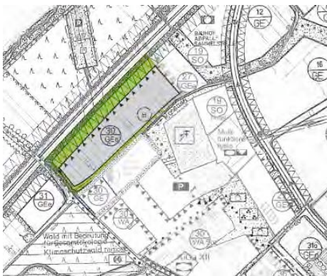
25. Änderung Teil III des Flächennutzungsplanes Unterschleißheim, 15.09.2008