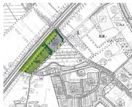
25. Änderung Teil IV des Flächennutzungsplanes Unterschleißheim, 27.08.2009