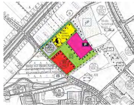
25. Änderung Teil II des Flächennutzungsplanes Unterschleißheim, 20.07.2009