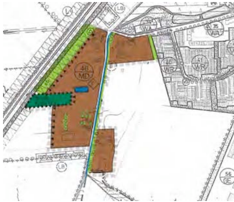
25. Änderung Teil I des Flächennutzungsplanes Unterschleißheim, 20.07.2009