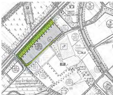
25. Änderung Teil III des Flächennutzungsplanes Unterschleißheim, 15.09.2008